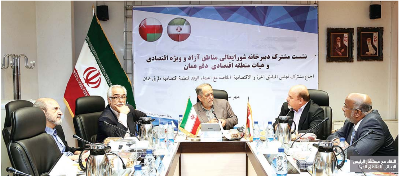
اللقاء مع مستشار الرئيس الإيراني للمناطق الحرة