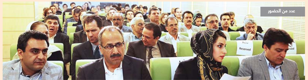
عدد من الحضور