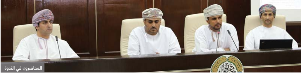
المحاضرون في الندوة