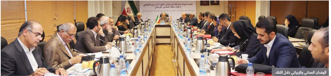
الوفدان العماني والإيراني خلال اللقاء