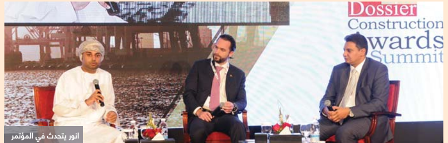
أنور يتحدث في المؤتمر