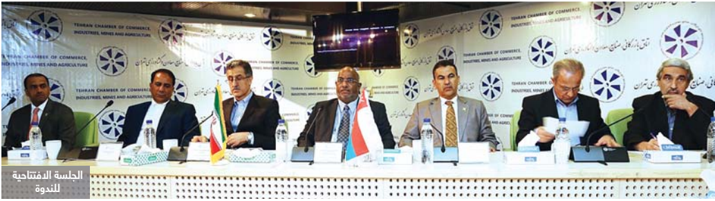
الجلسة الافتتاحية للندوة

نظمت هيئة المنطقة الاقتصادية الخاصة بالدقم في الفترة من ٢٧ سبتمبر وحتى الأول من أكتوبر ٢٠١٥م بالعاصمة الإيرانية طهران حملة ترويجية تحت شعار (الدقم تدعوكم) بمشاركة عدد من الجهات الحكومية والشركات العاملة والمستثمرة في المنطقة الاقتصادية الخاصة بالدقم.