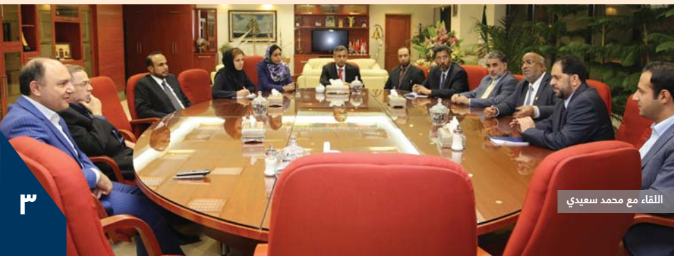
اللقاء مع محمد سعدي

التقى معالي يحيى بن سعيد بن عبدالله الجابري رئيس مجلس إدارة المنطقة الاقتصادية الخاصة بالدقم والوفد المرافق له سعادة محمد سعدي رئيس مجلس إدارة خطوط شحن جمهورية إيران الإسلامية (IRISL)، وقد تم خلال اللقاء بحث إمكانيات التعاون بين الجانبين، وأكد معالي يحيى بن سعيد الجابري أن المنطقة الاقتصادية الخاصة بالدقم تتمتع بقدرة