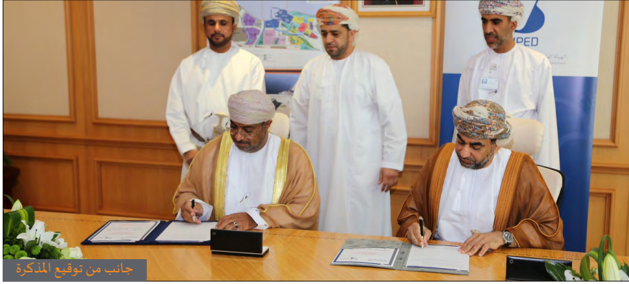
جانب من توقيع المذكرة