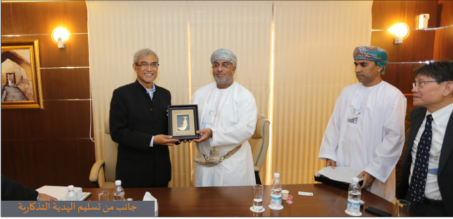
جانب من تسليم الهدية التذكارية