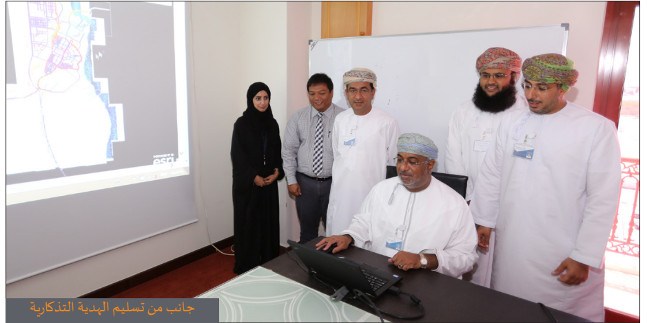
جانب من تسليم الهدية التذكارية

الجدير بالذكر انه تم دعم الموقع بأخر صور من الأقمار الصناعية لعام ٢٠١٤ م ومقارنتها بالصور الجوية السابقة والمتوفرة بالهيئة ومعاينة الفروقات الحالية والسابقة بمنطقة الدقم.