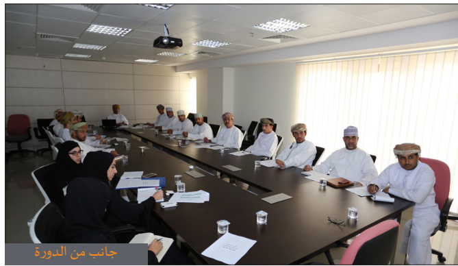
جانب من الدورة

نظمت هيئة المنطقة الاقتصادية الخاصة بالتعاون مع الادعاء العام دورة تدريبية في الضبطية القضائية لعدد من الموظفين المختصين في المجالات المختلفة ذات العلاقة امتدت ٥ أيام والتي حضرها متخصصين من شركة عمان للحوض الجاف وشركة ميناء الدقم، حيث هدفت الدورة التدريبية الى تنمية مهارات المتخصصين واحاطتهم بالقوانين والإجراءات الجزائية