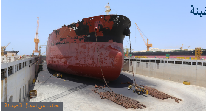
جانب من أعمال الصيانة