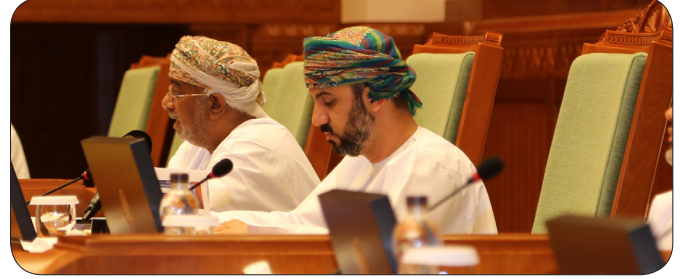
لقاء مجلس الشورى