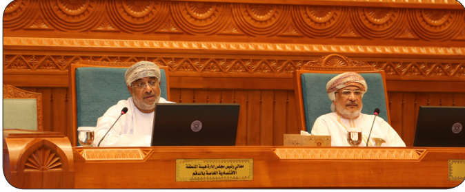
لقاء مجلس الدولة