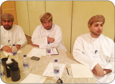
جانب من حضور الهيئة