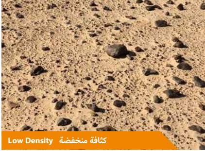
Low Density كثافة منخفضة