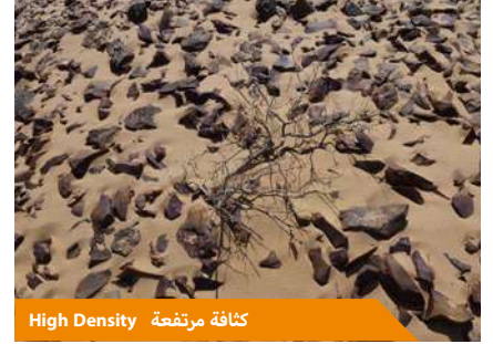
High Density كثافة مرتفعة