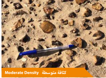
Moderate Density كثافة متوسطة