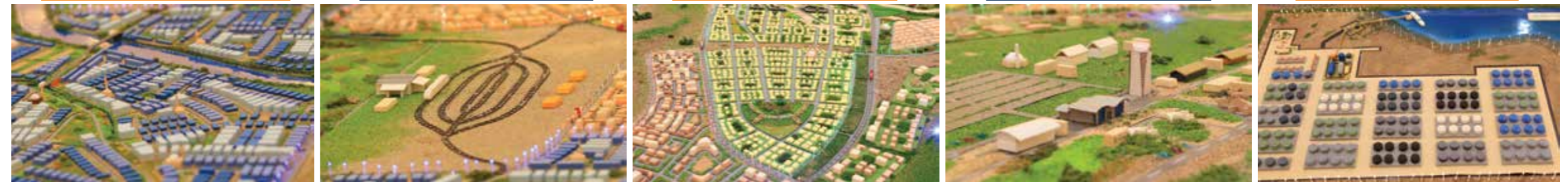
رأس مركز - Ras Markaz