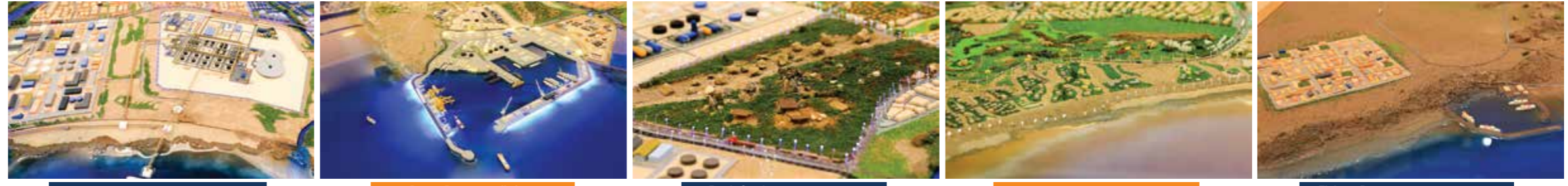
مصفاة الدقم - Duqm Refinery