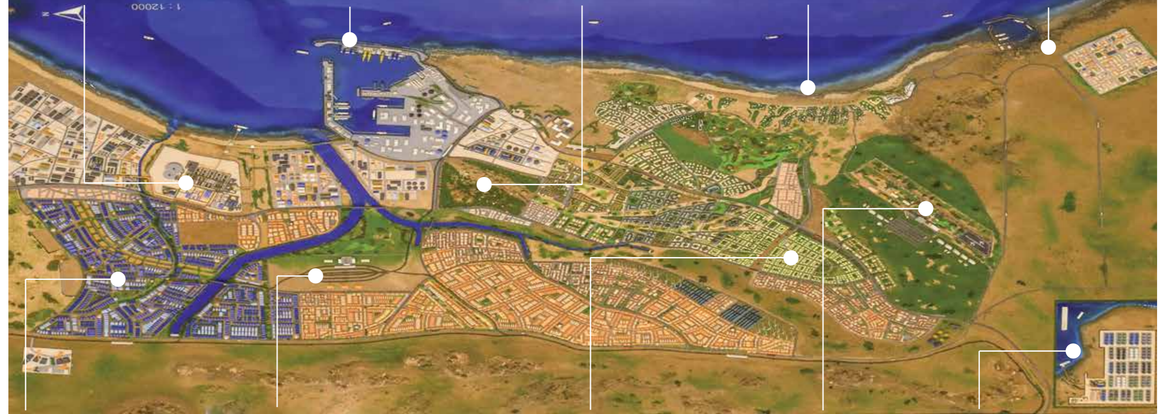
منطقة الصناعات الثقيلة - Heavy Industry